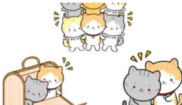
3密は避けて行動しましょう。

新型コロナウイルスに対する抗体反応についてはいまだ不明な点が多く臨床的な意義については確定していません。